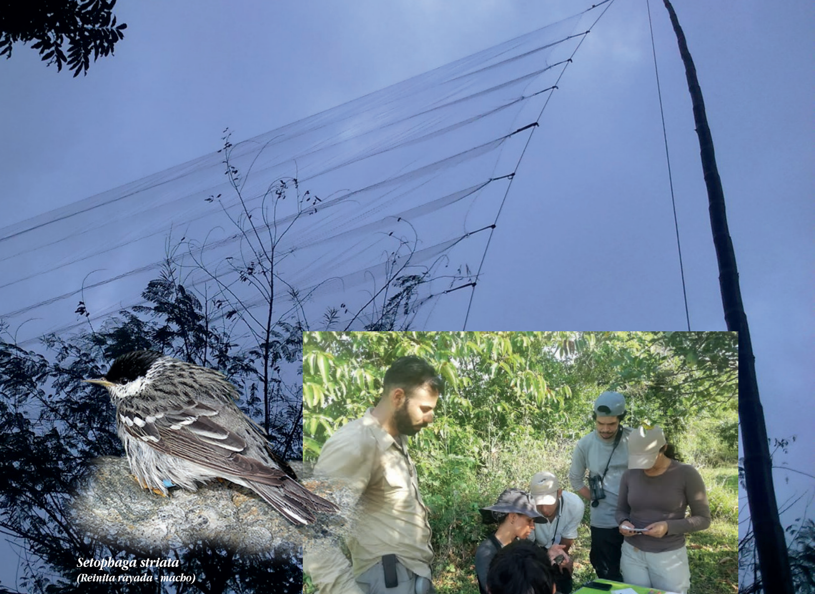
Setophaga striata (Reinita rayada - macho)